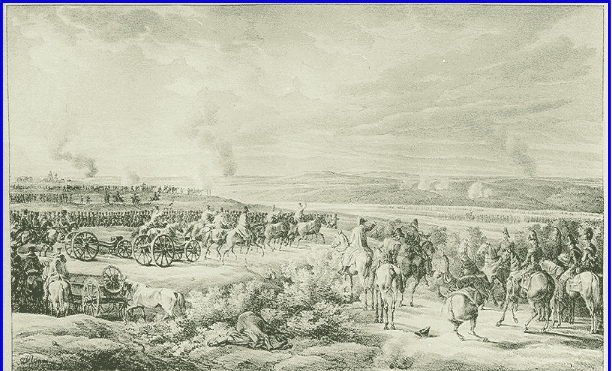
Начало боя за Шевардинскую позицию днем 25 августа. Наблюдатель находился чуть севернее Новой Смоленской дороги около д. Валуево. Видны результаты действия русских егерей у Колочи и артиллерии с террасы за правым берегом Колочи, Вдали (по центру) виден еще не вступивший в бой Шевардинский редут.

Французы предприняли ещё одну попытку овладеть укреплением. После ожесточенного боя войскам Компана вновь удалось ворваться на редут. Но русские пехотные полки, перейдя в контратаку, отбросили неприятеля на исходные позиции