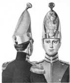
Гренадерские шапки Л.Г. Павловского полка, сохранившиеся в Муз. 1812 г.

Отличительная деталь экипировки grenадер Павловского полка, - головной убор старого образца. В отличие от всей пехоты павловцы сохранили отмененный у прочих с 1805г. особый головной убор grenадеров XVIII века – высокую островерхую шапку эпохи Фридриха Прусского с металлическим налобником. Эти шапки стали особой наградой нижним чинам, проявившим стойкость и мужество в боях. В 1808 году было принято решение состоящие в полку шапки оставить в том виде, в каком они сошли с поля сражения, несмотря на повреждения и вычеканивать на простреленных шапках имена тех чинов, которые вынесли их на себе с поля сражения.